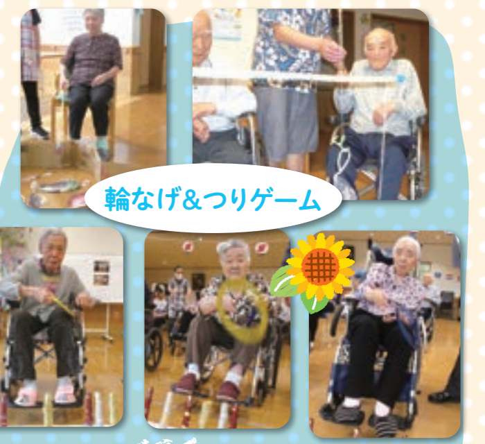
輪なげ&つりゲーム