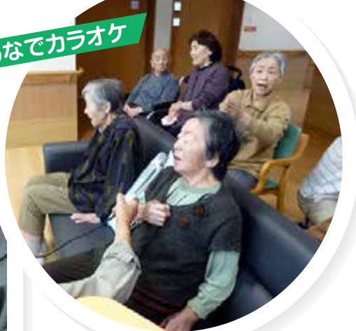
みんなでカラオケ