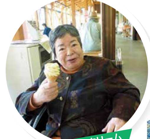
道の駅でアイスクリーム