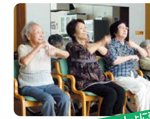
音楽といっしょに楽しく体操