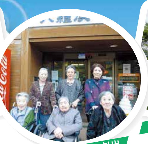
サンセット十六羅漢へ外出