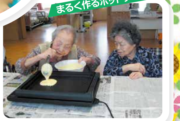
まるく作るホットケーキ